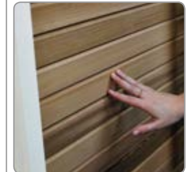
Lamellen können manuell in geöffnete oder geschlossene Position gedreht werden