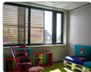
Drehbare Lamellen in zwei Bedienungsfelder unterteilt, damit zB das obere Lamellenfeld in geöffnete und das untere in geschlossene Position gebracht werden kann